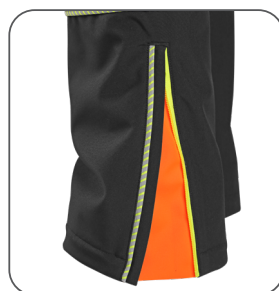
zip na nohavicích zipper at the bottom zamek na nogawkach