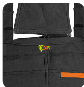
odepínací šle detachable braces odpinane szelki