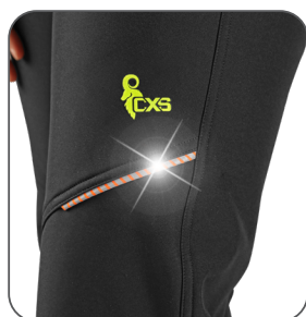
reflexní doplňky reflective accessories elementy odblaskowe