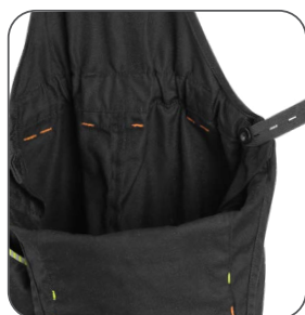
guma s knoflíkem pro přizpůsobení velikosti rubber with button for size adjustment guma z guzikiem do dostosowania rozmiaru