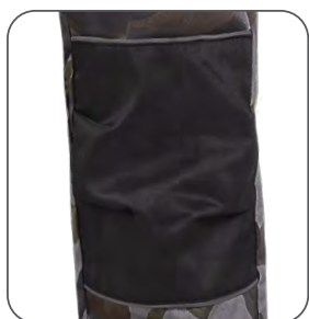
zesílená kolena reinforced knees wzmocnione kolana