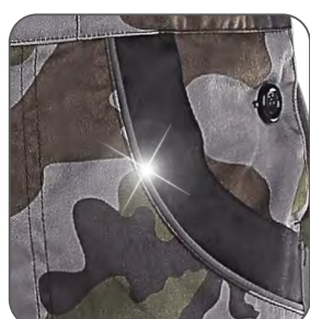
reflexní výpustky reflective stripes paski odblaskowe