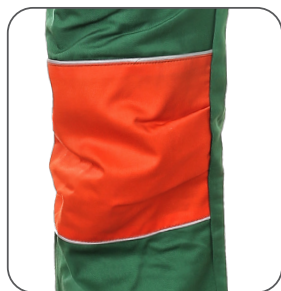
zesílená kolena reinforced knees kolana wzmocnione