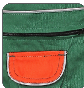
reflexní výpustky reflective stripes paski odblaskowe