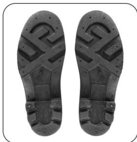
podešev podošva outsole podeszwa