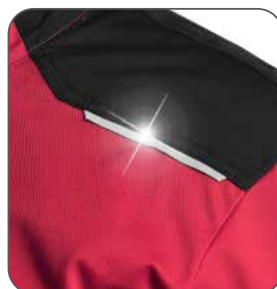
reflexní doplňky reflexné doplnky reflective accessories elementy odblaskowe