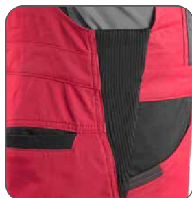
pruženka v bocích guma v bokoch elastic in the hips elastyczna gumka po bokach