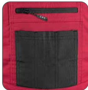
náprsní kapsy náprsné vrecká chest pockets kieszenie na piersi