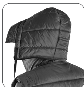
odepinací kapuce odnímateľná kapucňa detachable hood odpinany kaptur