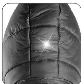
reflexní doplňky reflexné doplnky reflective accessories elementy odbłaskowe