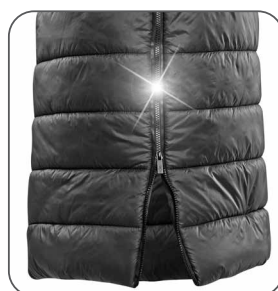
boční rozporek bočný rozparok side slit with boczne rozcięcie