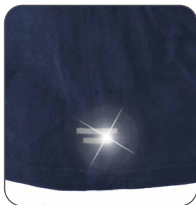
reflexní doplňky reflexné doplnky reflective accessories elementy odblaskowe