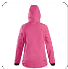
zadní strana zadná strana back side z tyłu