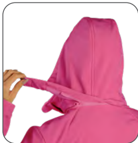
odepínací kapuce odnímateľná kapucňa detachable hood odpinany kaptur