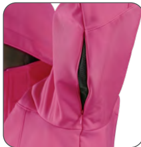
větrání v podpaží vetranie v podpazuší underarm ventilation wentylacja pod pachami